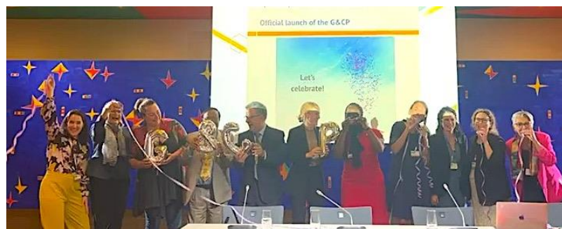
Launch of the Gender & Chemicals Partnership, September 2023

The relevance of the topic is also recognised internationally, and there is a growing demand for gender-responsive chemicals policy. This presents concrete opportunities for implementation. As part of the "Gender and Chemicals" project, MSP Institute has assumed the role of secretariat for the Gender & Chemicals Partnership ( G&CP ), a newly established international multi-stakeholder partnership with the aim of strengthening gender equality in chemicals management. To this end, we collaborate with United Nations organisations, governments, women's networks, NGOs, business associations and scientists. Additionally, the MSP Institute is doing advocacy work in the United Nations processes on the Global Framework on Chemicals and the establishment of a new Science Policy Panel on Chemicals, Waste and Pollution .