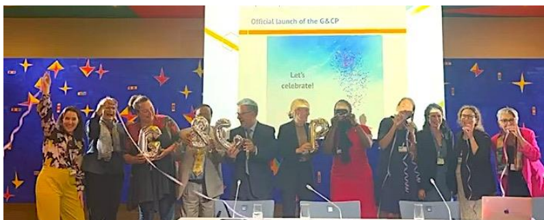
Launch der Gender & Chemicals Partnership, September 2023

Auch international wird die Relevanz des Themas anerkannt und eine geschlechter-gerechte Chemikalienpolitik angestrebt. Dies bietet nun Chancen zur konkreten Umsetzung: MSP Institute übernimmt im Rahmen des Projekts „Gender and Chemicals“ die Rolle des Sekretariats der Gender & Chemicals Partnership ( G&CP ), eine neugegründete internationale Multi-Stakeholder Partnerschaft mit dem Ziel, die Geschlechtergerechtigkeit im Chemikalienmanagement zu stärken. Hierzu arbeiten wir mit Organisationen der Vereinten Nationen, Regierungen, Frauennetzwerken, NROs, Unternehmensverbänden und Wissenschaftler*innen zusammen. Zudem beteiligt sich das MSP Institute aktiv an den Prozessen der Vereinten Nationen zum Global Framework on Chemicals und zum Aufbau eines neuen Science Policy Panels on Chemicals, Waste and Pollution .