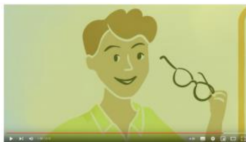
The gender lens - for a new perspective in chemicals management

Background: We can only overcome the planetary pollution crisis if we also take gender aspects into account. Find out more about the interconnection of gender and chemicals in our 2-minute info video :